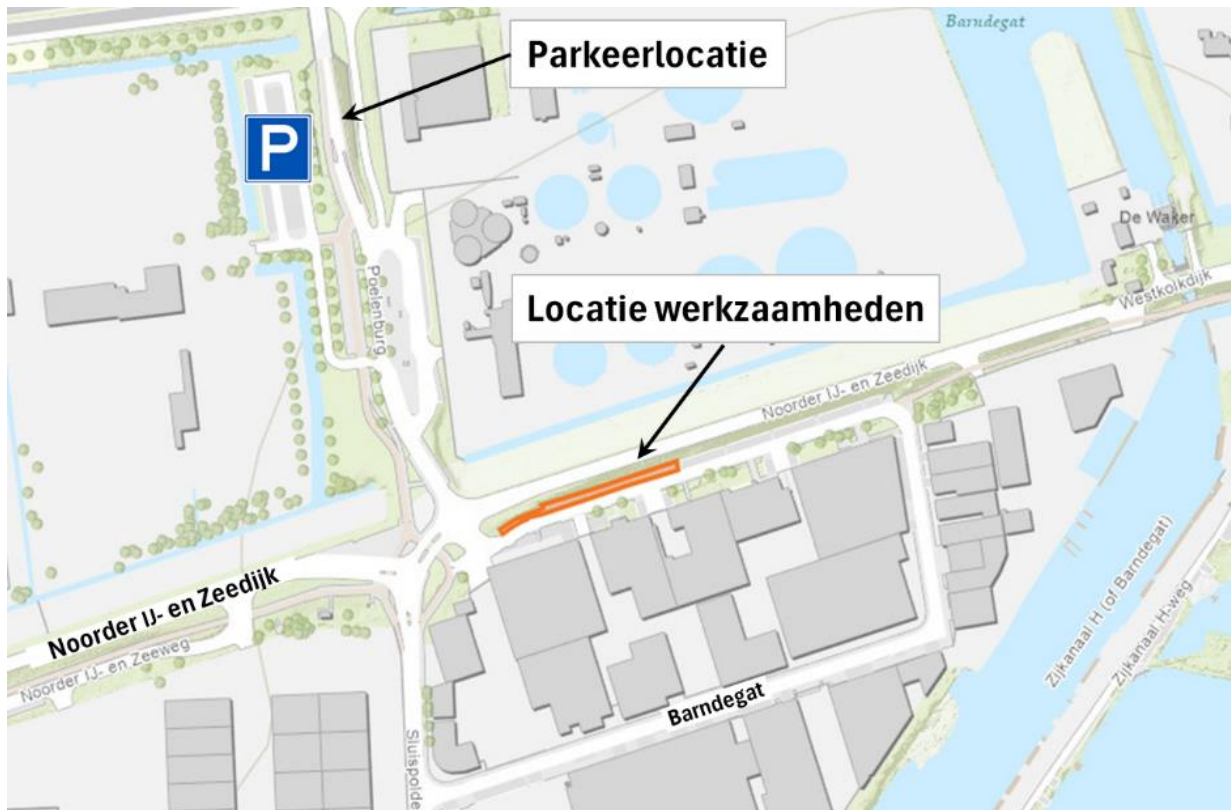
Afbeelding 2: Werklocatie en alternatieve parkeerlocatie