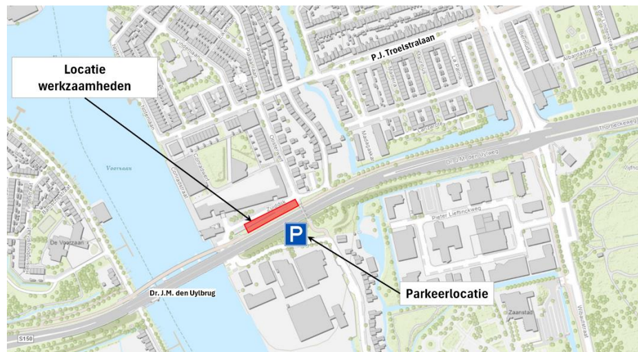
Afbeelding 1: Locatie werkzaamheden Zuidijk en alternatieve parkeerlocatie

In de periode van 2 september tot en met 11 november van 7.00 uur tot 17.00 uur worden er werkzaamheden uitgevoerd aan de Zuidijk. Voor deze werkzaamheden is het noodzakelijk dat er een groot deel van de parkeervakken tegen het talud van de Thorbeckeweg aan worden afgesloten. De werkzaamheden zijn voor het project Aanpak Verkeersdruk Thorbeckeweg - N516.