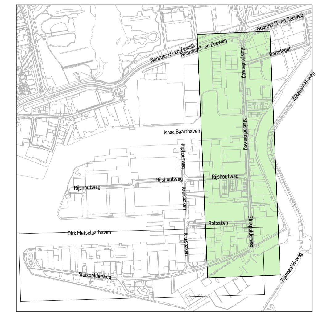
Overzicht situatie Schaal 1:1000